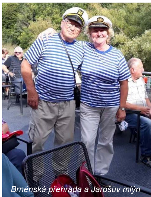
Brněnská přehrada a Jarošův mlýn