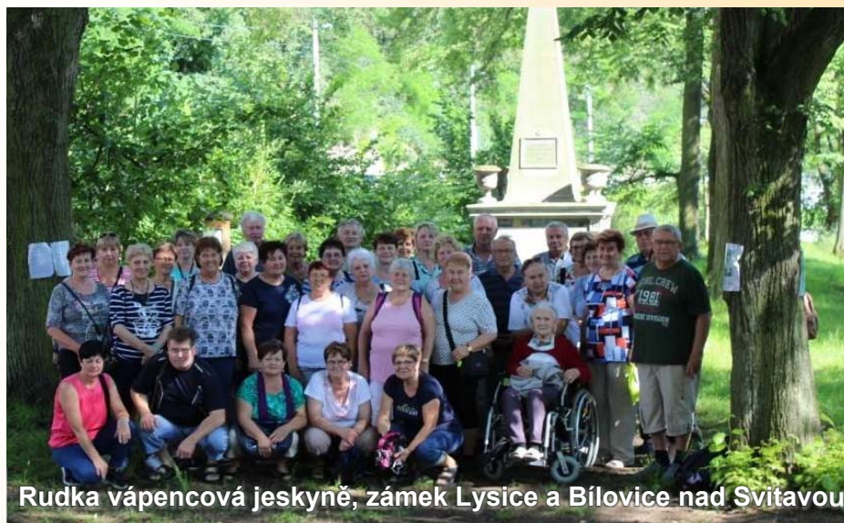
Rudka vápencová jeskyně, zámek Lysice a Bílovice nad Svitavou

Senioráček č. 2/20, vydává spolek KD-I Opatovice, www.kd-iopatovice.webnode.cz , e-mail: webklubduchodcu@seznam.cz