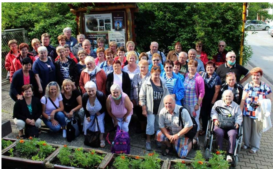
Rudka vápencová jeskyně, zámek Lysice a Bílovice nad Svitavou