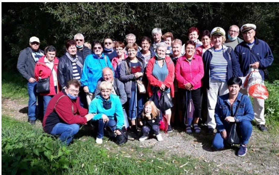
Brněnská přehrada a Jarošův mlýn