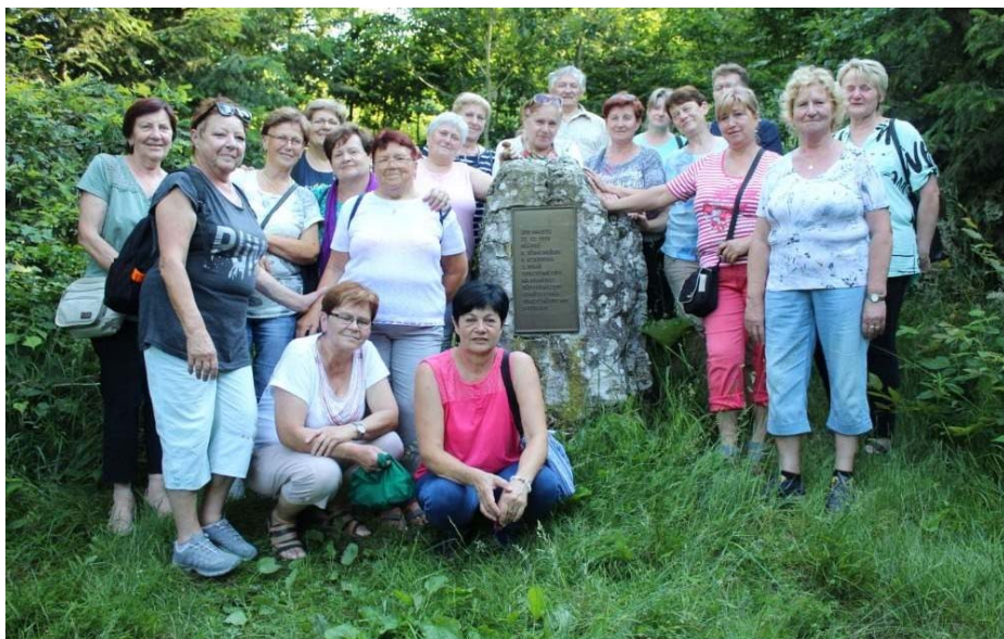
Rudka vápencová jeskyně, zámek Lysice a Bílovice nad Svitavou