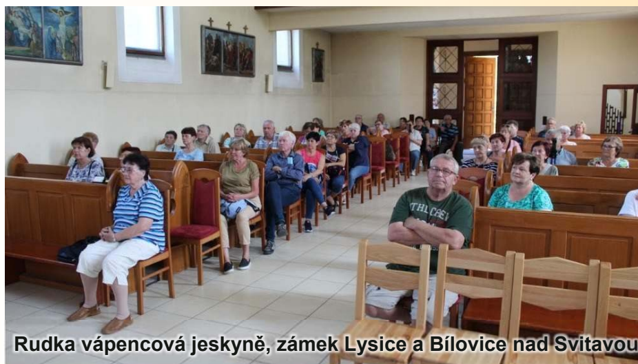
Rudka vápencová jeskyně, zámek Lysice a Bílovice nad Svitavou