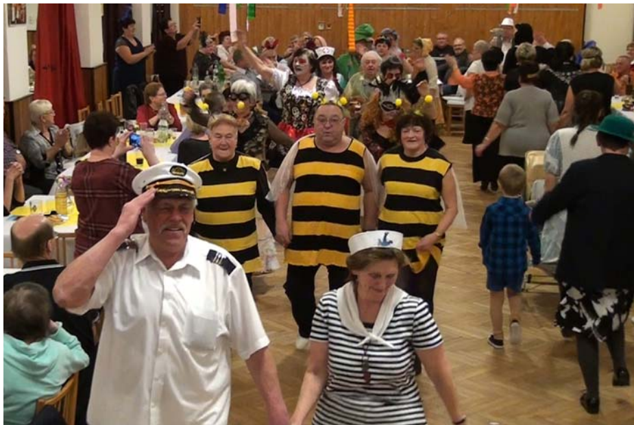
Maškarní ples 2019