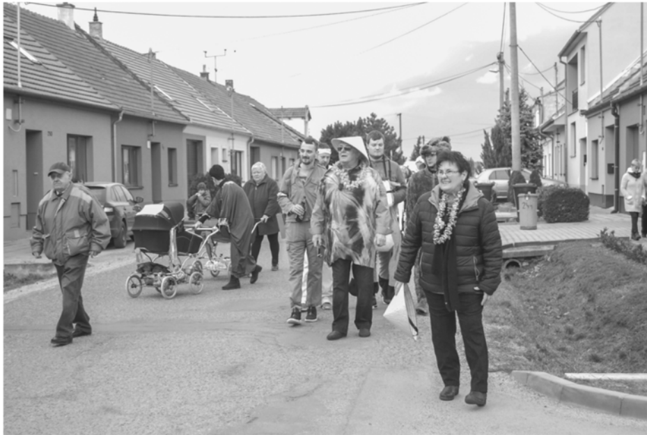
Pochovávání basy 2019