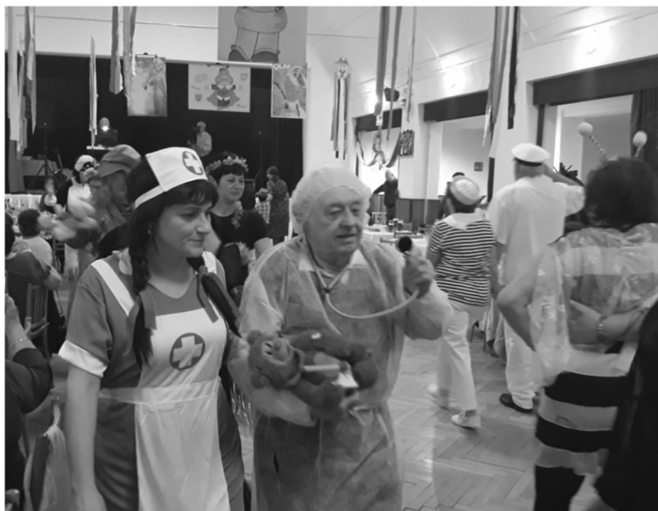
Maškarní ples 2019