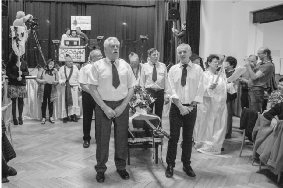
Pochovávání basy 2019