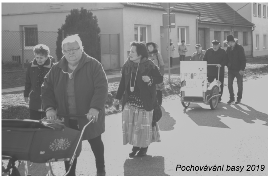
Pochováání basy 2019