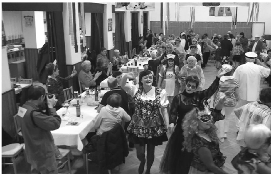
Maškarní ples 2019