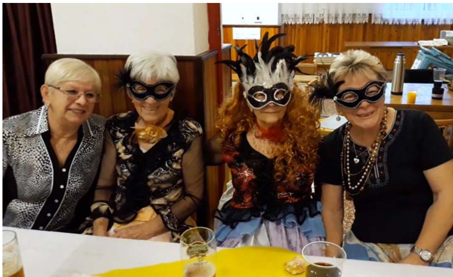
Maškarní ples 2019