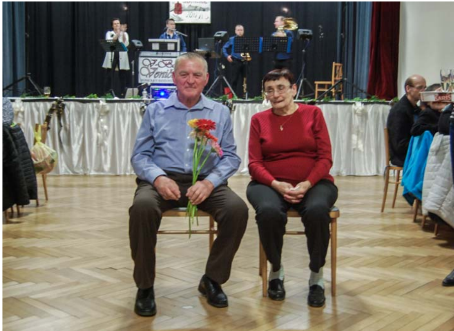
Pochováání basy 2019