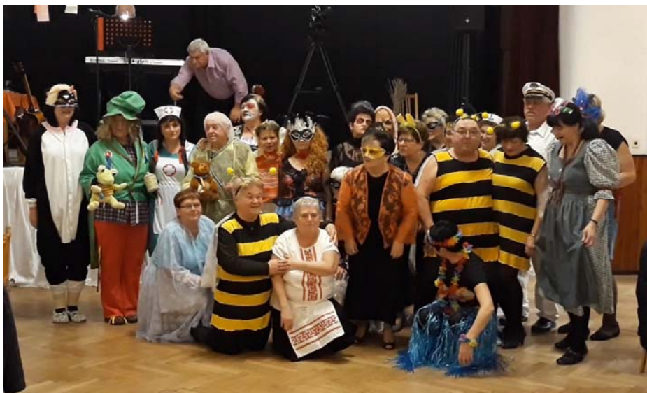
Maškarní ples 2019