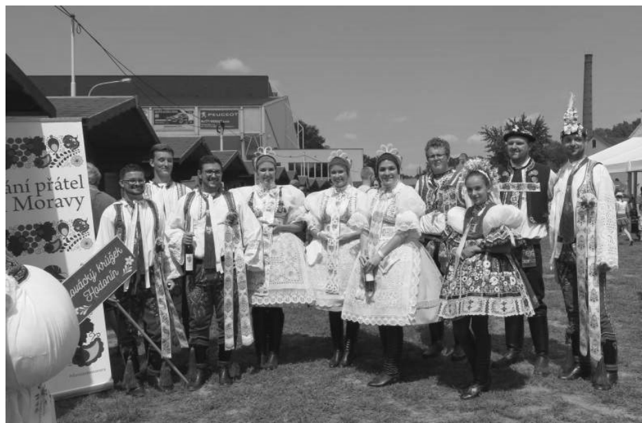
3. Setkání přátel jižní Moravy