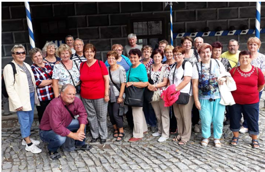
Český Krumlov, České Budějovice, Hluboká