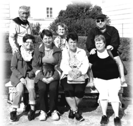
Zájezd Valtice a Mikulov

rozsáhlé židovské ghetto s 317 domy, z toho více než 90 renesančními, jen barokní synagoga, která slouží jako židovské muzeum, 45 domů chráněných jako nemovitá kulturní památka a velký hřbitov s několika tisíci náhrobků. Jeho nejstarší a nejcennější částí je takzvaný „rabínský vršek“ s náhrobky moravských zemských a místních rabinů a příslušníků nejbohatších mikulovských rodin.