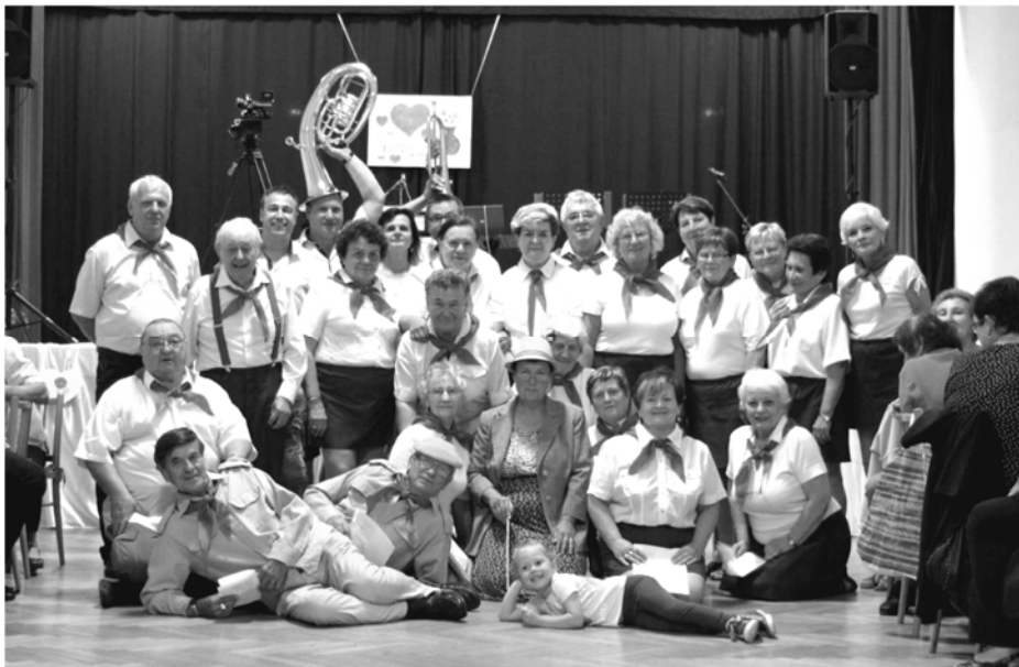
Den matek a otců