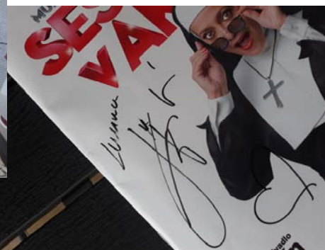
Muzikál sestra v akci

Senioráček č. 2/18, vydává spolek KD-I Opatovice, www.kd-iopatovice.webnode.cz , e-mail: webklubduchodcu@seznam.cz