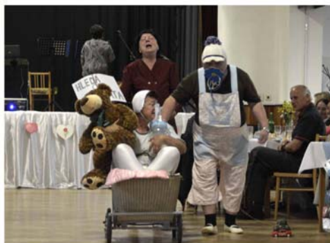
Den matek a otců