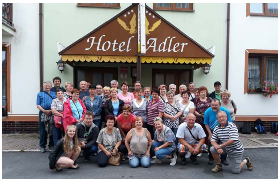
Český Krumlov, České Budějovice, Hluboká