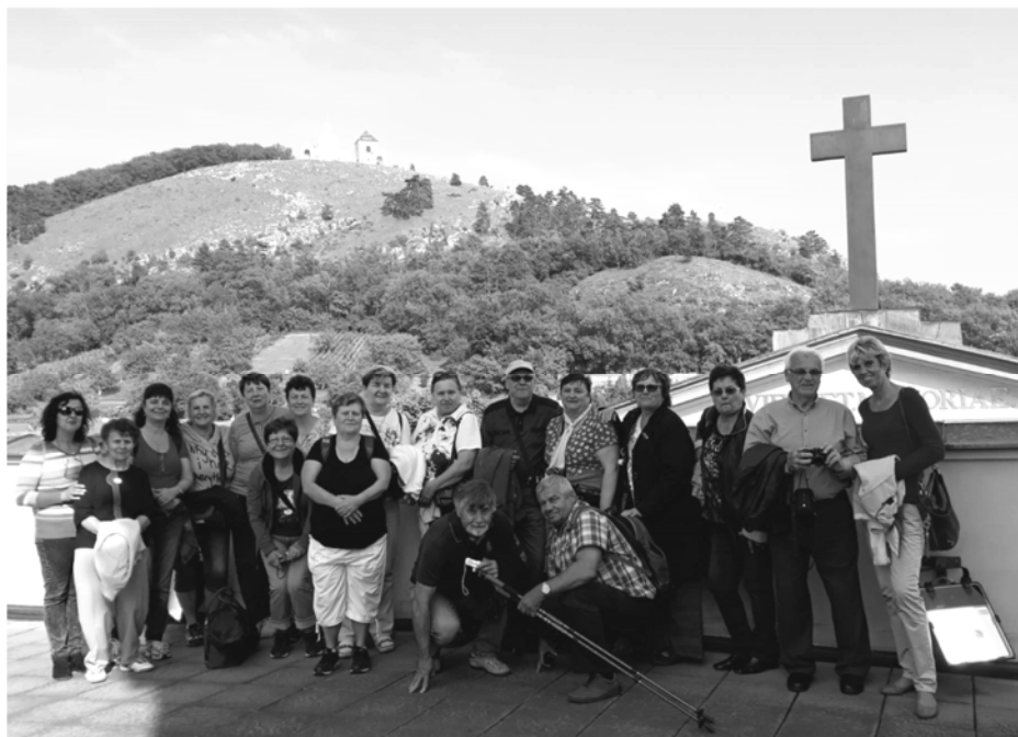
Zájezd Valtice a Mikulov