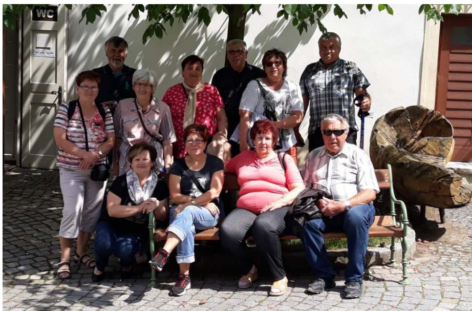
Zájezd Valtice a Mikulov