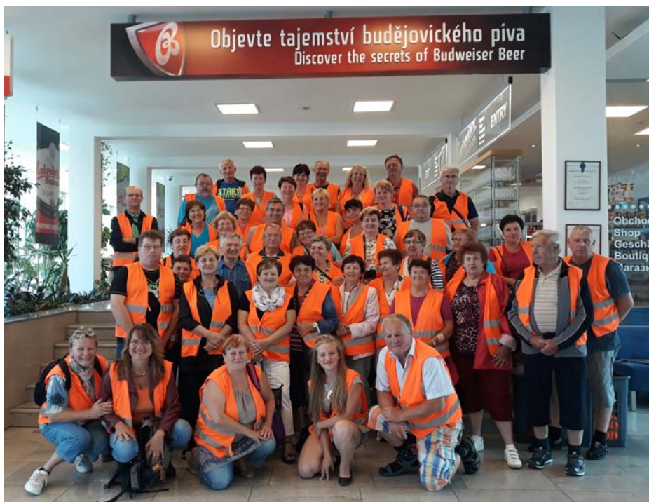
Český Krumlov, České Budějovice, Hluboká