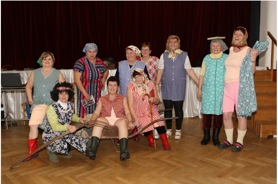
Den pro Ženy