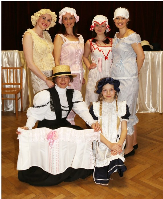
Den pro ženy